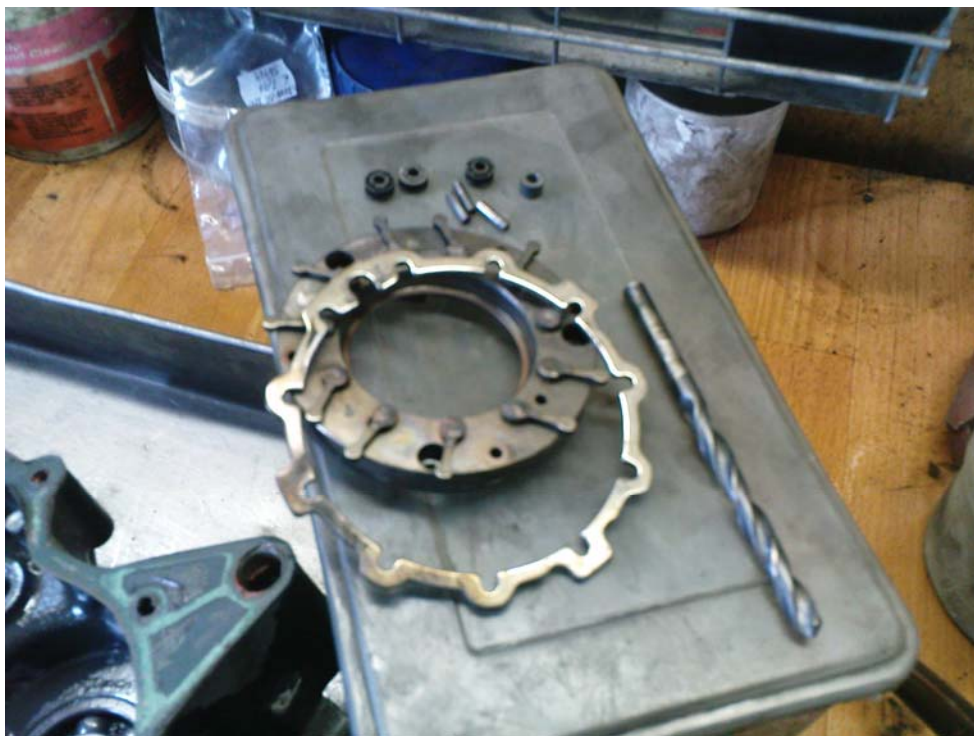
Turbo z vnútra: